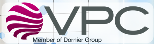
Top 10 products